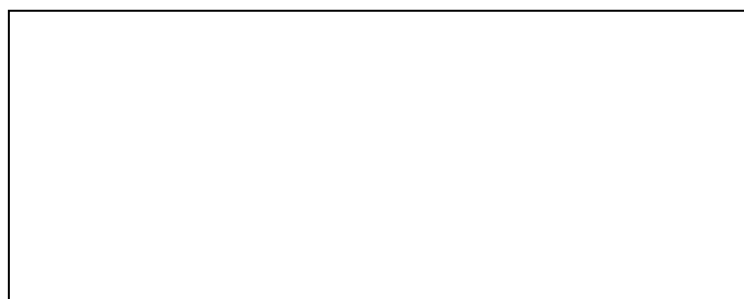
图 6-1 数据流